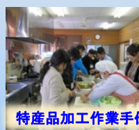
特産品加工作業手伝い

このため、宮崎県では、 県内の中山間地域に一定期間在住し、ボランティアで集落を支援する活動を行う「中山間盛り上げ隊」の中長期支援隊員 を募集しています。【隊員登録は随時受付】