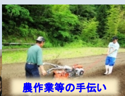
農作業等の手伝い